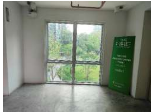
ภาพที่ 1.3-1 การระบายอากาศภายในอาคาร